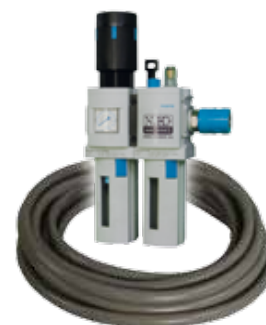
Obj. č. 27221 (pouze pro pneumatické modely)