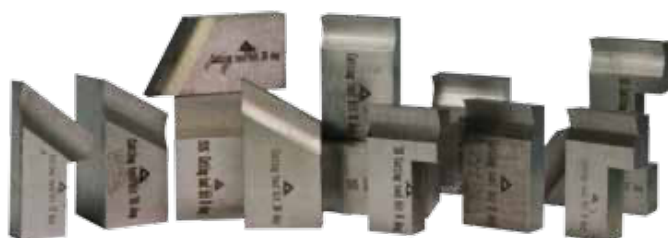
Řezné nástroje viz.strana 48 - 50