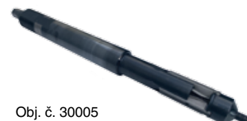
Obj. č. 30005