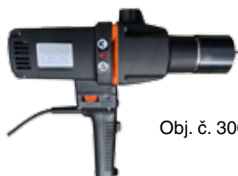
Obj. č. 30008