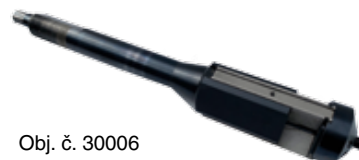
Obj. č. 30006