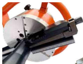
Obj. č. 30007