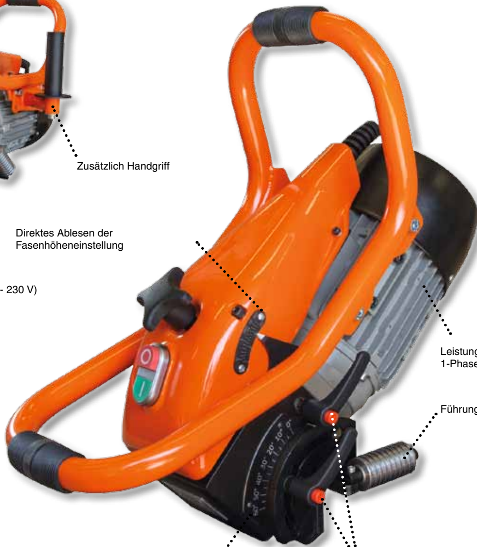
Leistungsstarker 1-Phasen 1100W Motor