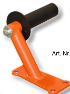
Art. Nr. 29206