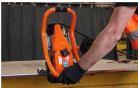
Schnell arretierbare Maschineneinstellung