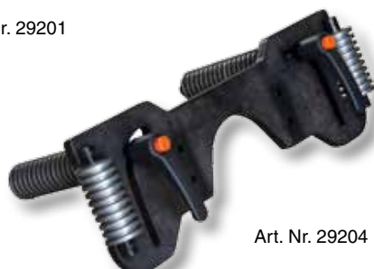
Art. Nr. 29204