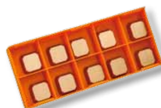
Art. Nr. 29203