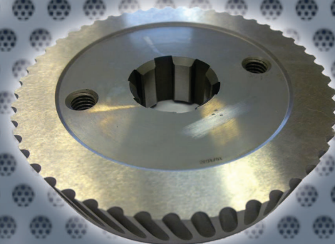
Obj. č. 2135 Nůž UNIVERZAL