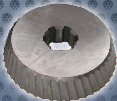
Obj. č. 1927 - Nůž