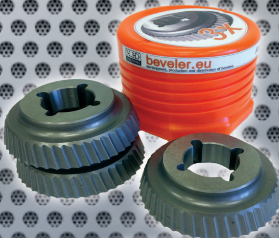
Obj. č. 2134 Set nožů 2137 pro UZ 15 - 3ks (cenově výhodné)