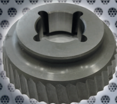
Obj. č. 2137 Nůž ECO