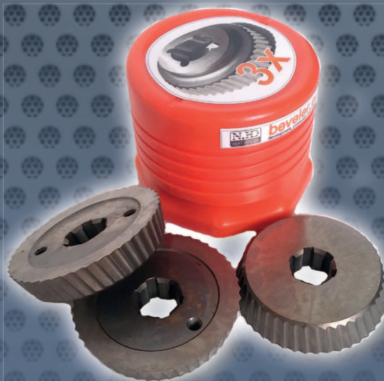
Obj. č. 1928 Set nožů 1927 pro UZ 12 - 3ks (cenově výhodné)