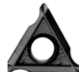
Obj. č. 24202