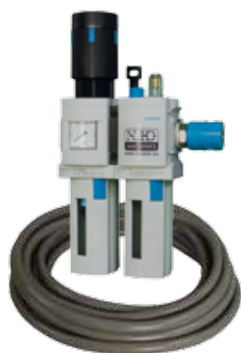
Obj. č. 24203