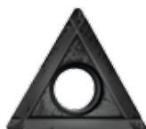
Obj. č. 24201