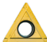
Obj. č. 24204