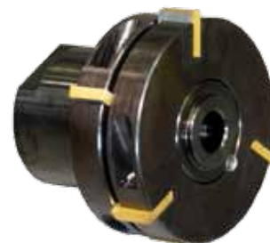
Obj. č. 29202