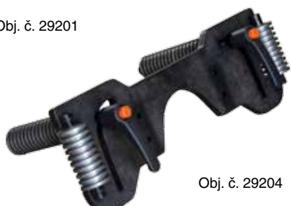
Obj. č. 29204