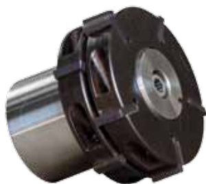
Obj. č. 29201