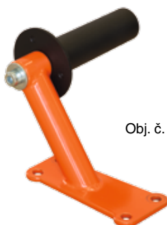
Obj. č. 29206