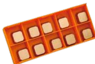
Obj. č. 29203