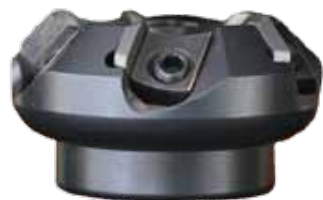
Obj. č. 28221