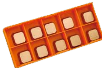
Obj. č. 25909